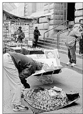
Venditori abusivi: un progetto per favorire l'integrazione

Annunciata una manifestazione di protesta. Insomma un'iniziativa, quella di Palazzo Vecchio, che secondo i rappresentanti della Lega non risolverebbe certo il problema dell'abusivismo in città.