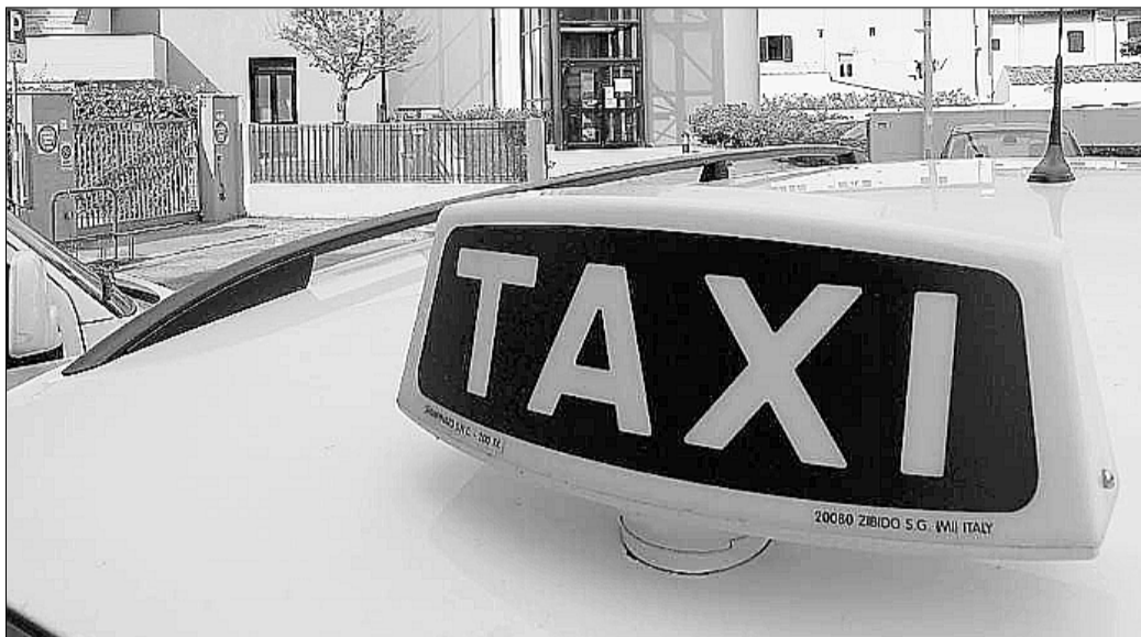
Licenze taxi Stilata la graduatoria provvisoria dei 60 vincitori

I 60 vincitori sono stati selezionati tra i 535 candidati che hanno partecipato al concorso: le domande presentate sono state 597. Tra i candidati che in classifica hanno ottenuto uguale punteggio, come previsto dal-